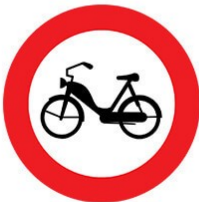
عبور موتور گازی ممنوع

۴- تابلوهای مشابه علامت خطر و ممنوع موتور و دوچرخه (فرق بین این تابلوها شکل مثلثی و دایره بون آن می باشد)