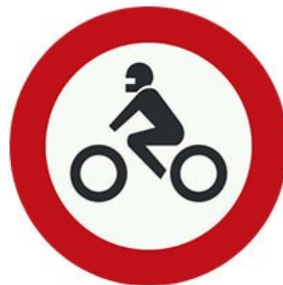
عبور موتور سیکلت ممنوع